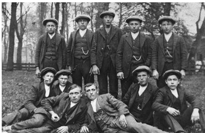
Tussen 1915 en 1925

Op zaterdag 3 juni vindt vanaf 10.00 uur 's morgens de traditionele viering van de Stoetbakkendag plaats.