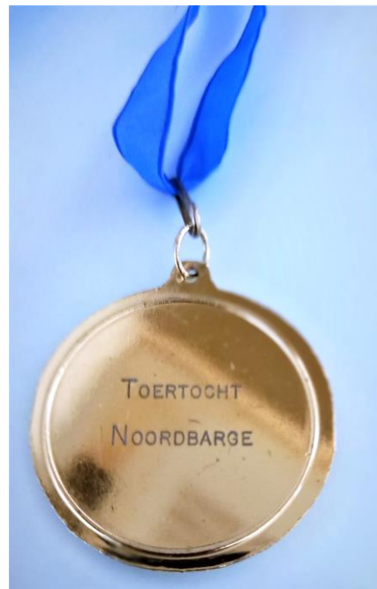
Achterkant van de medaille