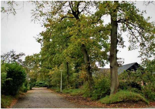
Ingang van de huidige Asserbrink met houtwal

De kavels werden gescheiden door houtwallen. Bij de zomerdag stond er ook koren op het land. Van de wal af naar beneden tussen de korenvelden. Een fantastische plek voor de jeugd voor een eerste ontluikende liefde. Ook planten als Wilgenroosje–Robertskruid–Salomonszegel–Kleefkruid vond je er. Tegenover de Stroetweg liep een zandweggetje naar de Stroeten, een deel hiervan is nog terug te vinden aan het begin van de Asserbrink. De jeugd ging er slootjespringen en kwam vaak met een nat pak thuis. Brummels plukken deed de jeugd hier ook, wat waren ze lekker. De afwatering in dit gebied gebeurde door het stroompje de Oude Delft. Dit stroompje