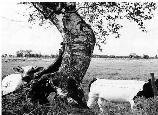
Doorkijk in de Stroeten

In de jaren 1971 tot 1985 werd op de gronden van de Stroeten een deel van de nieuwe wijk Bargerres gebouwd. Op dit moment is er sprake van veroudering van de wijk en zijn er plannen om de wijk anders in te richten, men spreekt van revitalisering oftewel nieuw leven inblazen. Een groep bewoners heeft een prijs gewonnen met een ontwerp onder de naam 'Gevonden Landschap'. Bewoners, gemeente Emmen, Domesta, woningstichtingen Lefier en Domesta, waterschap de Vechtstromen werken hierin samen. Oude bomenwallen moeten beter zichtbaar worden en ook de afwatering krijgt de nodige aandacht. Overloopvijvers dienen te verdwijnen. Ze zijn niet goed voor gezondheid en milieu. Een nieuw aan te leggen stroompje, onder de naam Oude Delft dient, weer voor de afwatering te gaan zorgen. Het is allemaal te mooi om waar te zijn, de geschiedenis herhaalt zich.