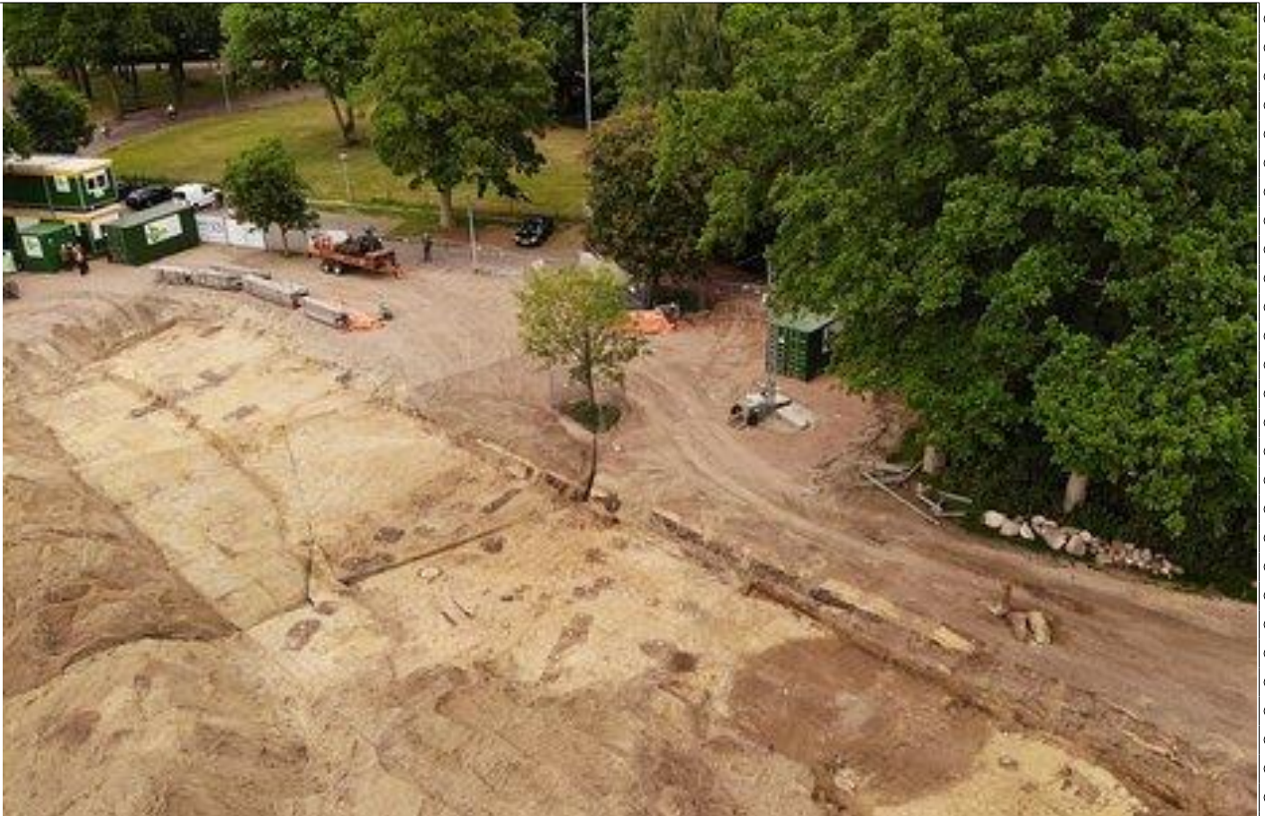
Archeologisch veldonderzoek binnen de Stratingehof in mei 2019